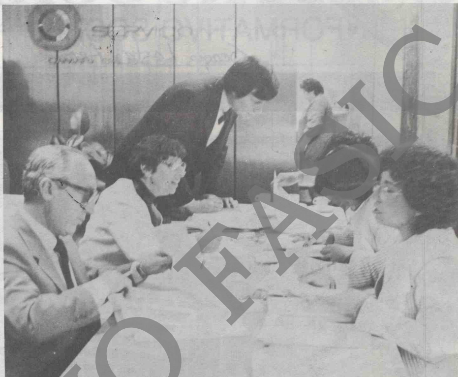
Concurrida fue la 21a. Asamblea de Adherentes del Servicio Médico de la Cámara Chilena de la Construcción. La foto muestra una de las mesas en que se inscribían los apoderados asistentes.

• En el Departamento de Radiología se observó un aumento del 10,4% en las radiografías tomadas, las que llegaron a 2.631 en el año.