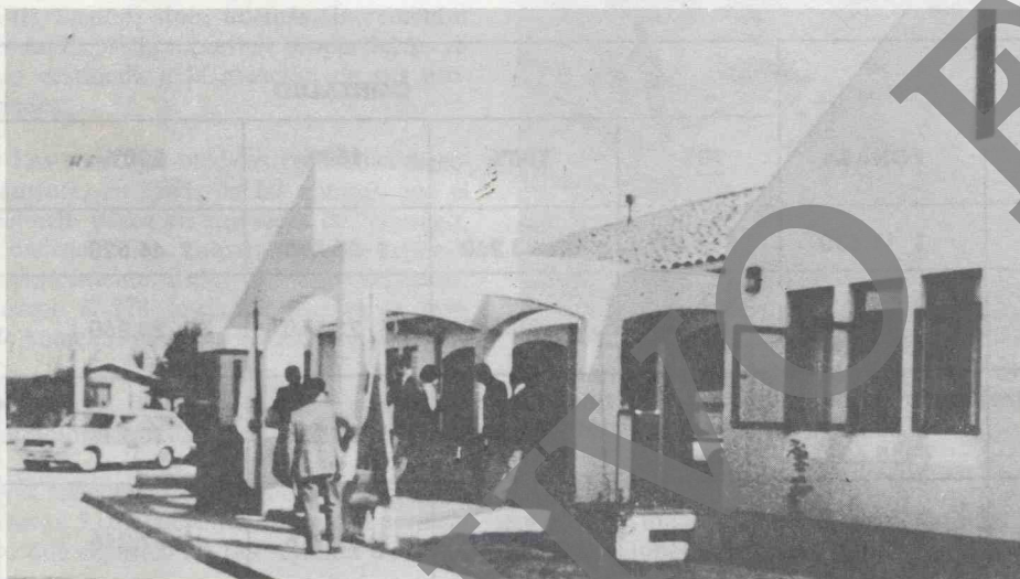
La Mutual en Rancagua

ARICA: Avda. Argentina 2247, fono 41237; IQUIQUE: Orella 769, fono 22735; ANTOFAGASTA: Washington 2489, fono 222415; CALAMA: Vic. Mackenna 2048, fono 212171; LA SERENA: Carrera 864, fono 211134; VIÑA DEL MAR: Alvarez 1210, fono 883720; SANTIAGO: Avda. Lib. Bernardo O'Higgins 4848, fono 792241; RANCAGUA: Rep. de Chile 395, fono 22280; CURICO: Avda. España 1191, fono 1088; TALCA: Uno Oriente 1350, fono 34407; CONSTITUCION: Avda. Talca s/n, fono 234; LINARES: Freire 693, fono 462; CHILLAN: 18 de Septiembre 355, fono 23392; CONCEPCION: Paicavi 9595 (Autopista), fono 27391; LOS ANGELES: Colo Colo 598, fono 22177; TEMUCO: Avda. Holandesa 0615, fono 35323; VALDIVIA: Avda. Prat 1005, fono 3151; OSORNO: Mackenna 1491, fono 4224; PUERTO MONTT: Diego Portales 510, fono 2054; CASTRO: Thompson 214, fono 784; COYAHAIQUE: Carrera 335, fono 21457; PUNTA ARENAS: Lautaro Navarro 850, fono 26750