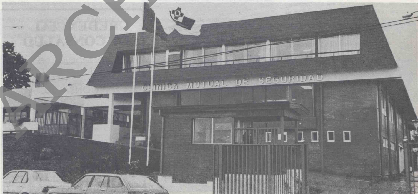
La Mutual en Valdivia